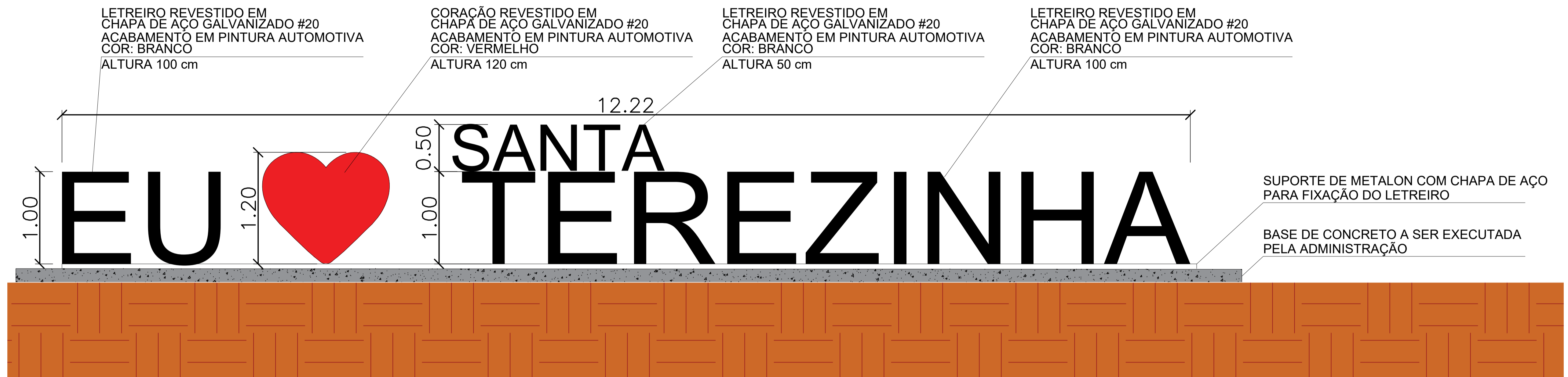
LETREIRO SANTA TEREZINHA ESCALA 1:25